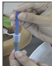
用研磨杵粉碎样品提取蛋白质